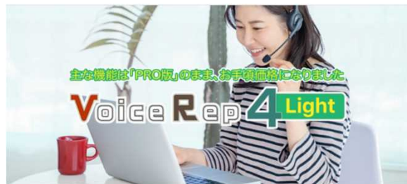
ユーザー様へのインタビューの様子

高齢者はスマホが使いづらく、メールも打ちにくいと聞きます。そういったお客様のお声から開発された音声認識ソフトです。